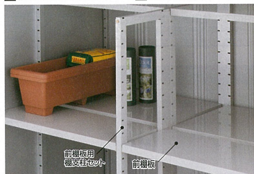
前棚板を取付ける場合：別途棚支柱が必要となる場合があります。