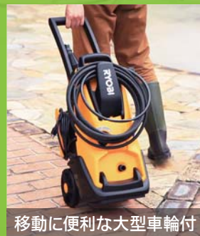
移動に便利な大型車輪付